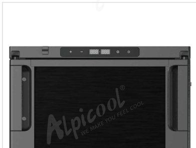
Puerta reversible en simultáneo

LRT4X4 SRL DISTRIBUIDOR OFICIAL EN ARGENTINA - GARANTIA OFICIAL 12 MESES