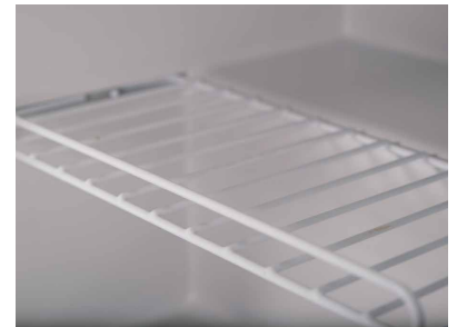
Estantería con revestimiento de PVC