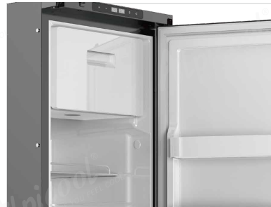
Freezer y Heladera